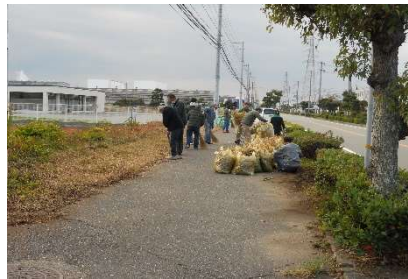
歩道脇の雑草の草刈り・清掃