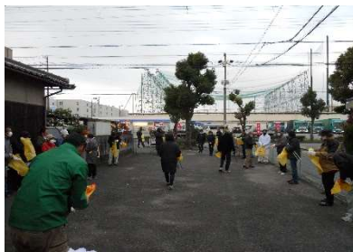
一斉清掃に集合する会員