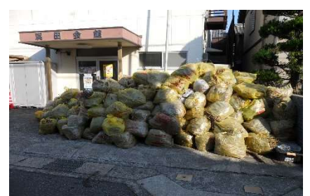
多くのゴミを回収